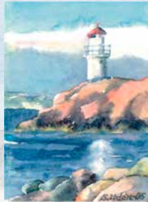
Akvarell: Solveig Udén